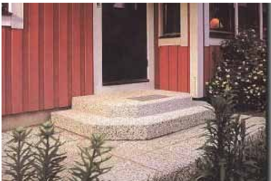
Entrétrappa typ Kavaljer