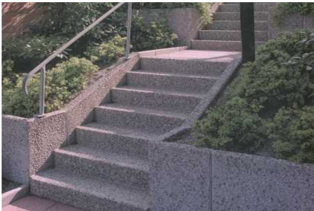
Vinkelelement i terrassering med delvis lutande överkant. Yta: frilagd ballast.